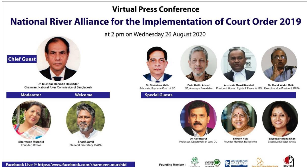
ছবি ২: Banner of the virtual press conference to launch the National River Alliance for the Implementation of the Court Order 2019 (River Alliance CO 2019), August 26, 2020.